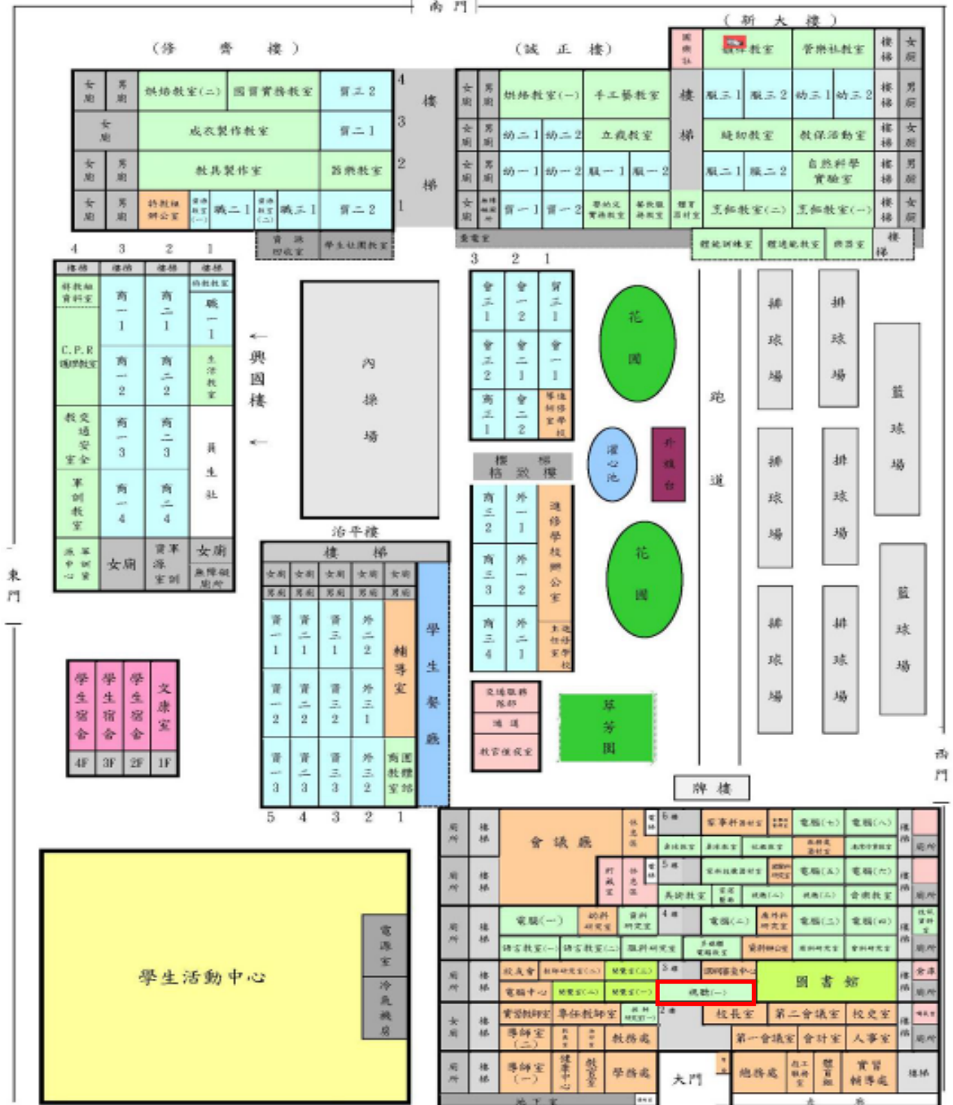
國立臺中高級家事商業職業學校 101 學年度教室平面圖 101.08.01