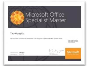
微軟 MOS 國際認證電子證書樣式